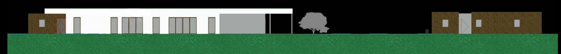
řez budovou mš: